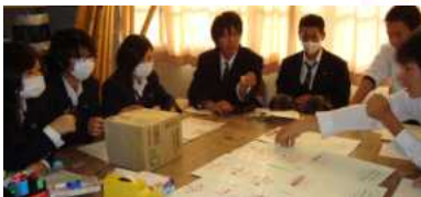
生徒会執行部による企画の様子