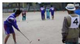
ゲートボール大会