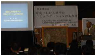
教育講演会 広島大学大学院 総合科学研究科教授 浦光博先生