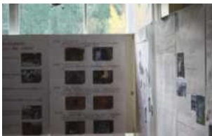
探究活動の中間発表会

1日目には講演会・軽音部舞台発表が行われました。2日目は一般公開とし、軽音部舞台発表, 看板コンテスト, 各クラスの展示, 探究活動の中間発表, 地域の方々とのゲートボール大会, 各クラスの食品バザー, PTAによる物品・食品バザー等が行われ, 約200名以上の方にご来場していただきました。なお, PTA物品バザーにおきましては, 保護者の皆様や地域の方々にご協力いただき誠にありがとうございました。