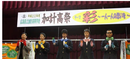
加計高 Deckies ミニコンサート