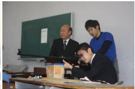
ライフル射撃体験