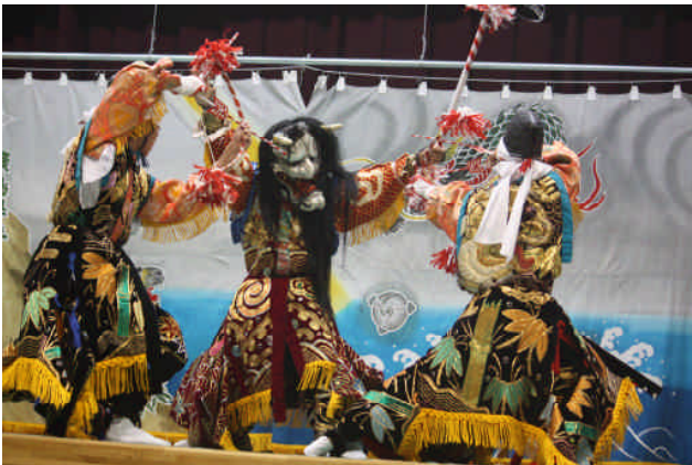
神楽「弓八幡」 ミスコン (Mr.Lady コンテスト)