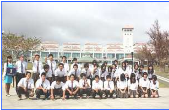
ひめゆりの塔にて

10月16日(火)~19日(金), 3泊4日の日程で, 2年生が沖縄に修学旅行に行きました。ひめゆり平和祈念資料館や系数アブチラガマでの平和学習の他, 沖縄文化体験・マリンスポーツ体験・美ら海水族館見学などを行い, 沖縄の文化や自然にふれることができ, とても良い思い出となりました。