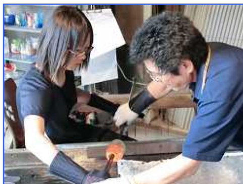
琉球ガラス細工体験

私達は修学旅行で沖縄に行きました。朝5時に加計を出て10時半に沖縄に着きました。沖縄ではひめゆりの塔と平和公園に行き, 戦争のことについて学び, 広島戦争とは違って考えさせられました。台風で天候が悪かったですが, 海にも入って初めてのスキューバダイビングを体験しました。沖縄料理も美味しくとても楽しい修学旅行でした。