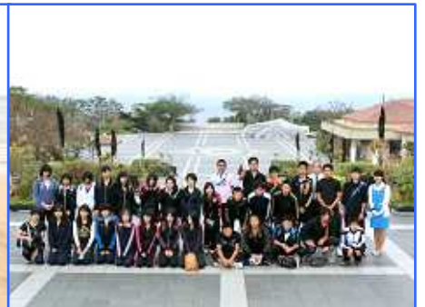
美ら海水族館にて