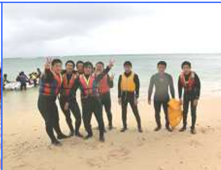
マリンスポーツ体験