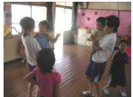
保育所での職業体験の様