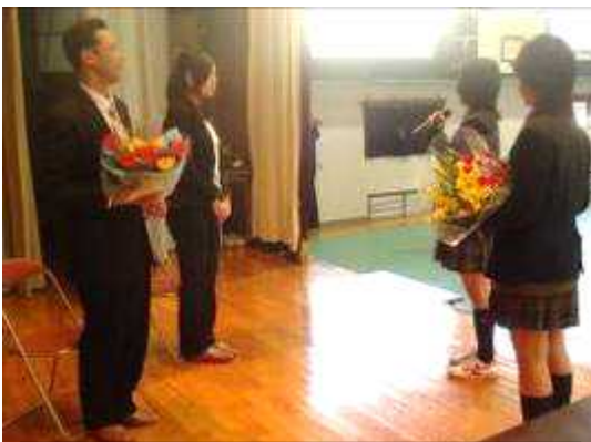
生徒会より感謝の言葉、記念品贈呈