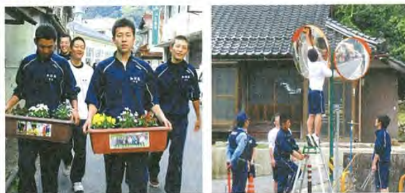
地域の「花いっぱい運動」には、多くの生徒が自主的に参加。毎月、道路清掃活動を行っており、ある月は通学路の交通安全の確保のため、カーブミラーを磨いて回った。