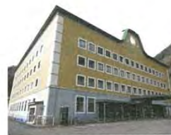
同校の寮や公営塾が入った町の施設

普通科 / 1922年設立 / 生徒数104人(男子66人・女子38人) 進路状況(2016年3月実績) 大学6人・短大2人 専門学校7人・就職14人 広島県山県郡安芸太田町加計3780-1 TEL 0826-22-0488 URL http://www.keke-h.hiroshima-c.ed.jp/