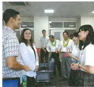
昨年度はハワイと韓国の姉妹校および台湾の高校から訪問団が来校。神楽の篠笛演奏や茶道などで交流した。